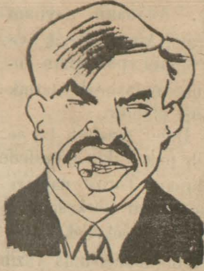
Fransız Başbakanı Laval

İşyarlar Sayısı Azaltılıyor. Böylece 5 Milyar Frank Tasarruf Edilecek.